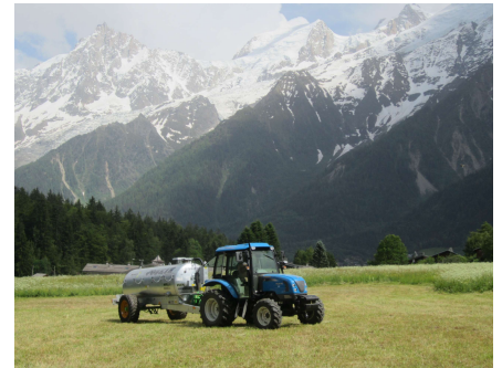
Tonne à lisier