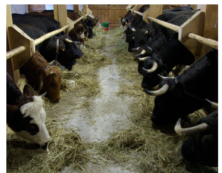
Alimentation des vache au foin