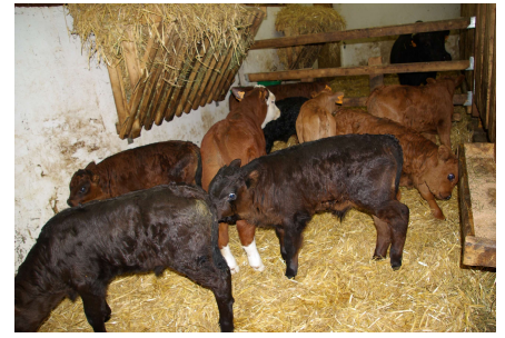
Veaux sur aire paillée

Alors oui on vous l'accorde, ça ne sent pas la rose ! L'odeur est plus ou moins forte selon l'alimentation des animaux (plutôt désagréable dans le cas d'apport d'ensilage) et selon l'espèce (bovins, ovins, caprin, ou porcs). Nous ne choisissons pas non plus le jour de l'épandage. Ce choix se fait en fonction de la météo et de notre emploi car nous sommes pour la plupart pluriactifs. Nous préférerions nous prélasser le dimanche mais le métier de paysan ne connaît pas les weekends... alors soyez indulgents et respirons ensemble la nature!