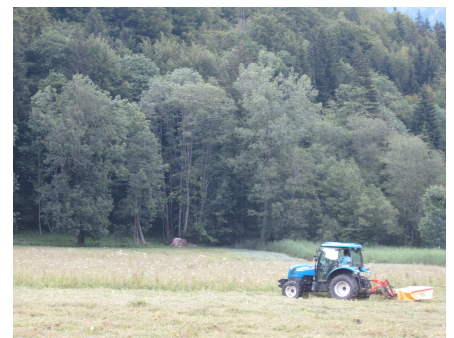
Récolte du fourrage